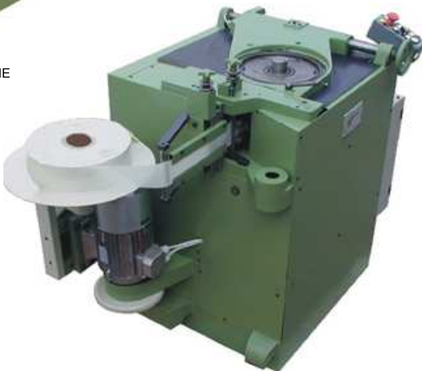
ISOLATRICI FONDO CAVA SLOT BOTTOM INSULATING MACHINE MODELLO/MODEL "STATOMAT"

FASP AUTOMAZIONI - Via Chemello, 22 - Montecchio Maggiore - 36075 VICENZA - Italy Tel. +39.0444.499039 E-mail: info@faspautomazioni.com - Web: www.faspautomazioni.com