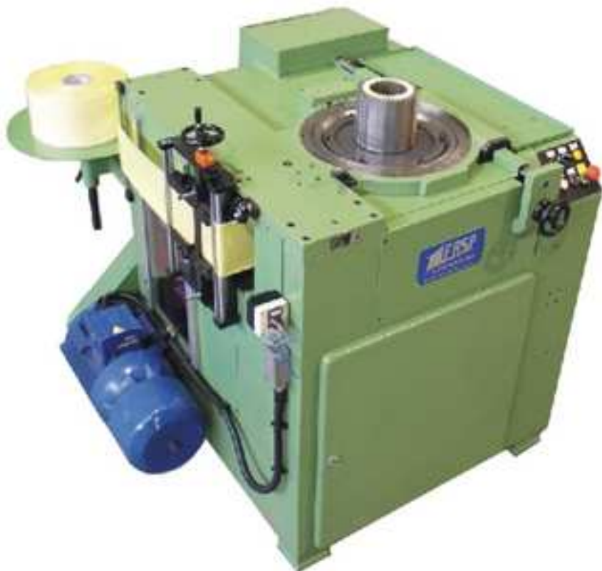
ISOLATRICI FONDO CAVA SLOT BOTTOM INSULATING MACHINE MODELLO/MODEL "PAVESI"