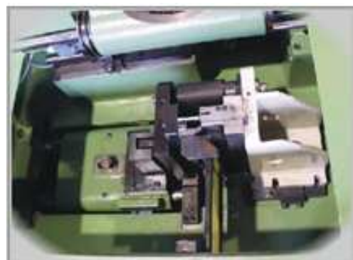
ATTREZZATURA CON DISPOSITIVO DI CAMBIO RAPIDO TOOLING WITH QUICK CHANGE