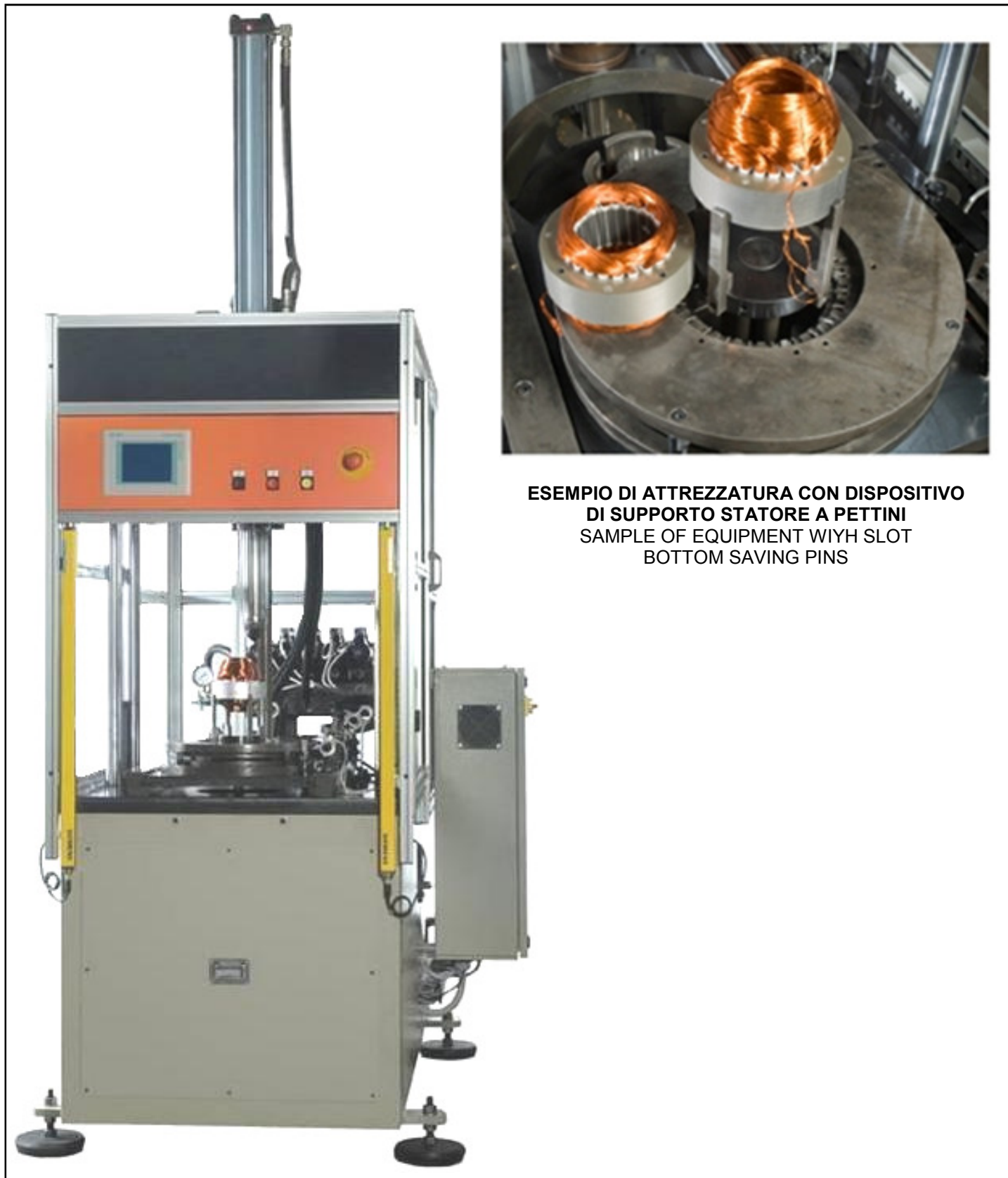
ESEMPIO DI ATTREZZATURA CON DISPOSITIVO DI SUPPORTO STATORE A PETTINI SAMPLE OF EQUIPMENT WITH SLOT BOTTOM SAVING PINS

FASP AUTOMAZIONI - Via Chemello, 22 - Montecchio Maggiore - 36075 VICENZA - Italy Tel. +39.0444.499039 E-mail: info@faspautomazioni.com - Web: www.faspautomazioni.com