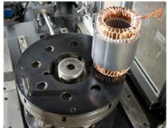
ESEMPIO DI ATTREZZATURA DI FINITURA CON DISPOSITIVO DI SUPPORTO STATORE A PETTINI SAMPLE OF FINAL EQUIPMENT WITH SLOT BOTTOM SAVING PINS

FASP AUTOMAZIONI - Via Chemello, 22 - Montecchio Maggiore - 36075 VICENZA - Italy Tel. +39.0444.499039 E-mail: info@faspautomazioni.com - Web: www.faspautomazioni.com