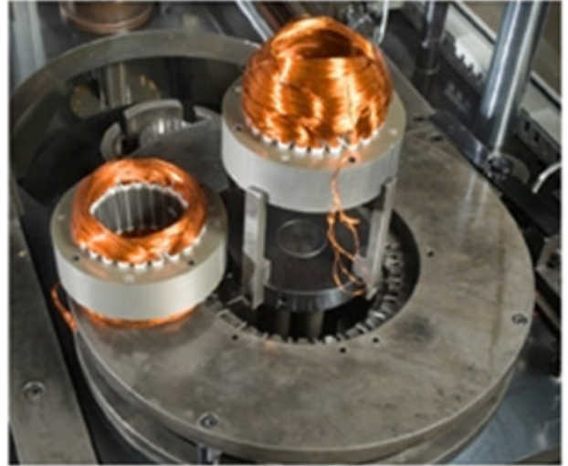
ESEMPIO DI ATTREZZATURA CON DISPOSITIVO DI SUPPORTO STATORE A PETTINI SAMPLE OF EQUIPMENT WITH SLOT BOTTOM SAVING PINS